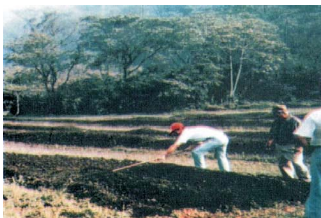
Figura 3. Cama o lecho establecido en el suelo